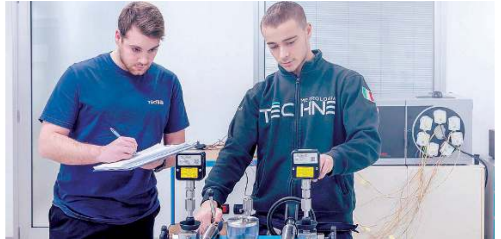
Metrologia. L'azienda con sede a Brescia in via della Musia è partner di numerose industrie del territorio